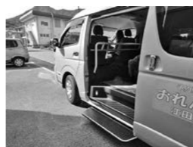
電動ステップや手すりがついて 乗りやすくなりました。