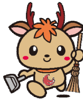
広島県アダプト制度 マスコットキャラクター「アダピィ」