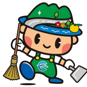
江田島市アダプト制度 マスコットキャラクター「アダプトくん」