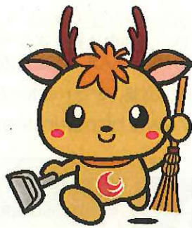
「広島県アダプト制度」マスコットキャラクター アダピィ