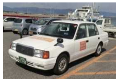
●セダンタイプ (定員4名) 沖美北部線で運行