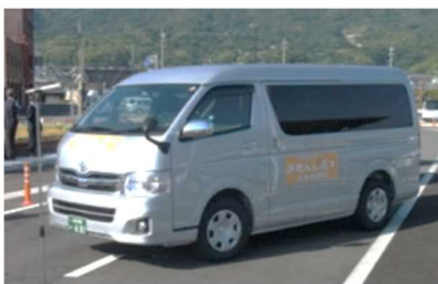
●ワンボックスタイプ (定員9名) 江田島北部線・沖美南部線・大須朝夕便で運行