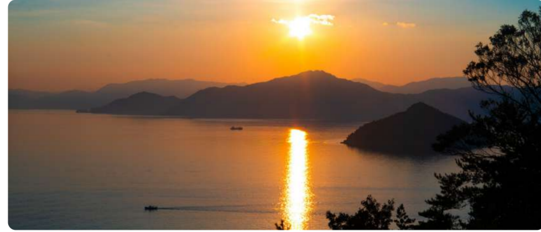
沖美町のきらめくサンセット ポジティブシンキング 田中廣宏