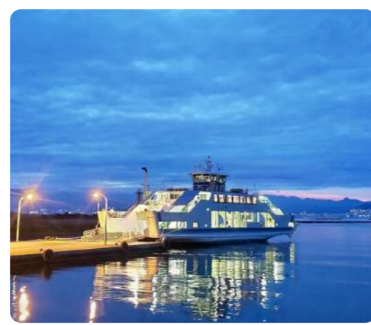
日々の中のプレミアム 日是好日がモットー 谷本由美子