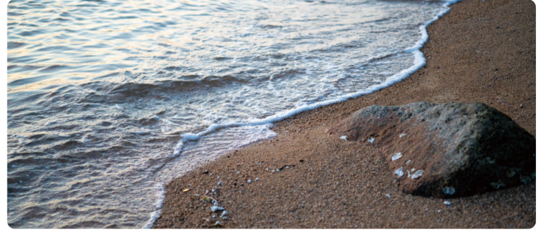
人にこびることもなく、ただただ打ち寄せてくる波 春夏秋冬 耳をすませば出会える、島での一期一会。 鳥っ子だけ島の魅力を学び直し中！ にったやすみ