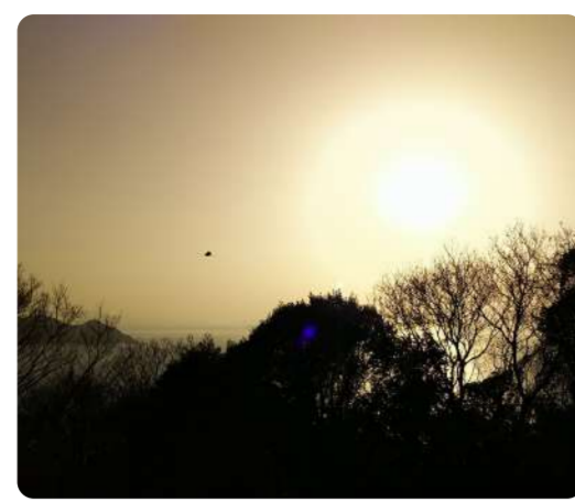
宇根山から望む瀬戸内海 白金に輝く冬の海 日是好日がモットー 谷本由美子