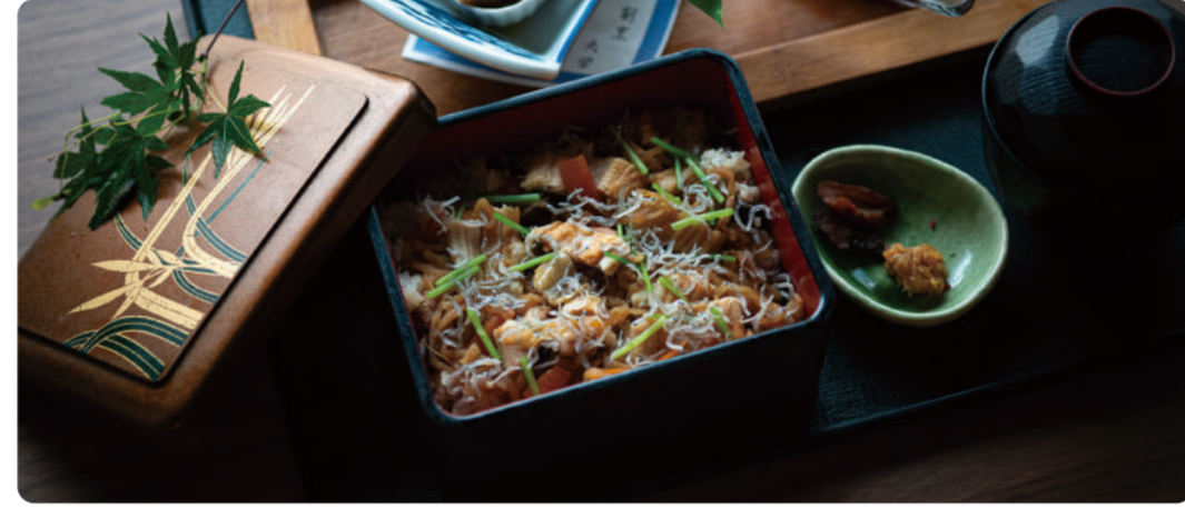
安徳天皇が食べた800年以上の歴史がある郷土料理がある 「御も」って知ってる? エタジマ大学 学長 森原健一