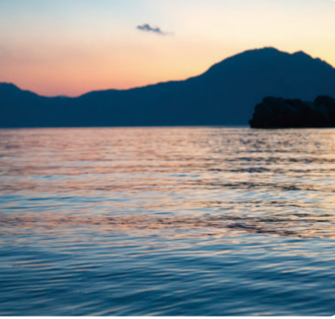
西海岸の夕日、岸根、サイコー! 江田島を出て10年、Uターンしてはや2年 ノリユキ