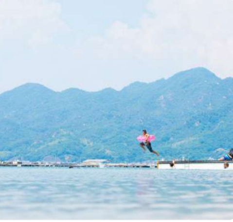
住むのにも、遊びにくるにも、 丁度いい田舎！江田島。 江田島を出て10年、Uターンしてはや2年 ノリユキ