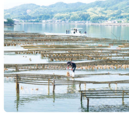
江田島は自然の美しさと歴史・文化・美味しい食べ物がそろった、 魅力的な島です。夏は海、冬はカキ料理が自慢です 江田島の空気で育った 佐々木鉄次