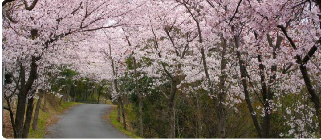
真道山、千本桜、 パノラマ、サイコー!! SHIROSO-KOで待っています! 田中浩文