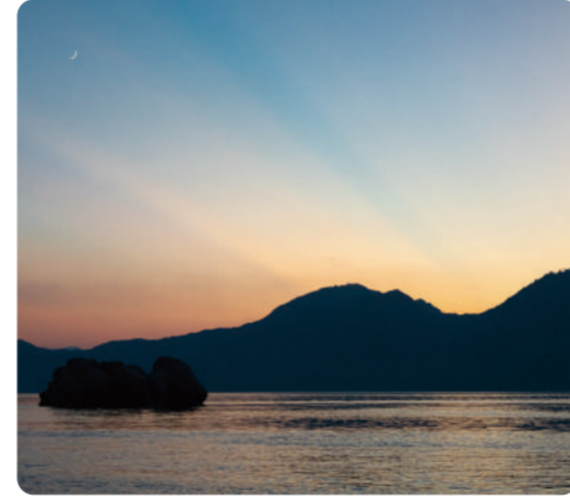
夕日のね グラデーションが、ええんよね 江田島市観光協会 6年目 キッシー