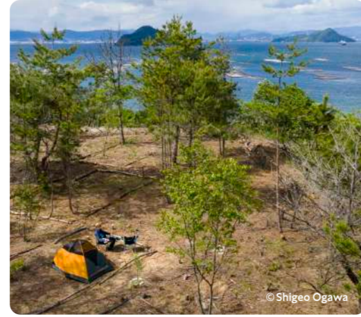
瀬戸内海国立公園! キャンプ場オーナー 秋田浩一