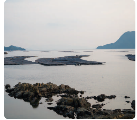
島にだけ流れてる、筏を渡る 独特な時間を感じて欲しい 何でもない小さな発見が、日々を彩る幸せ 山田京子