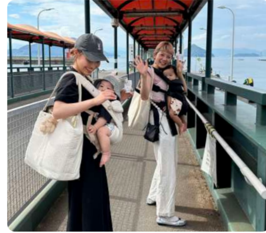
江田島って市内からちょうどいい 距離だし、小旅行気分だよ〜♪ どこでもオーシャンビュー！海が大好き！ 移住1年目はるくんファミリー みきちゃん、はるき