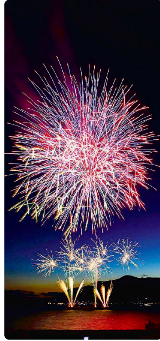
いなか暮らししながら 都会の空気も満喫 大橋高幸で島を出て、定年退職後に沖美町にUターン 越山浩則