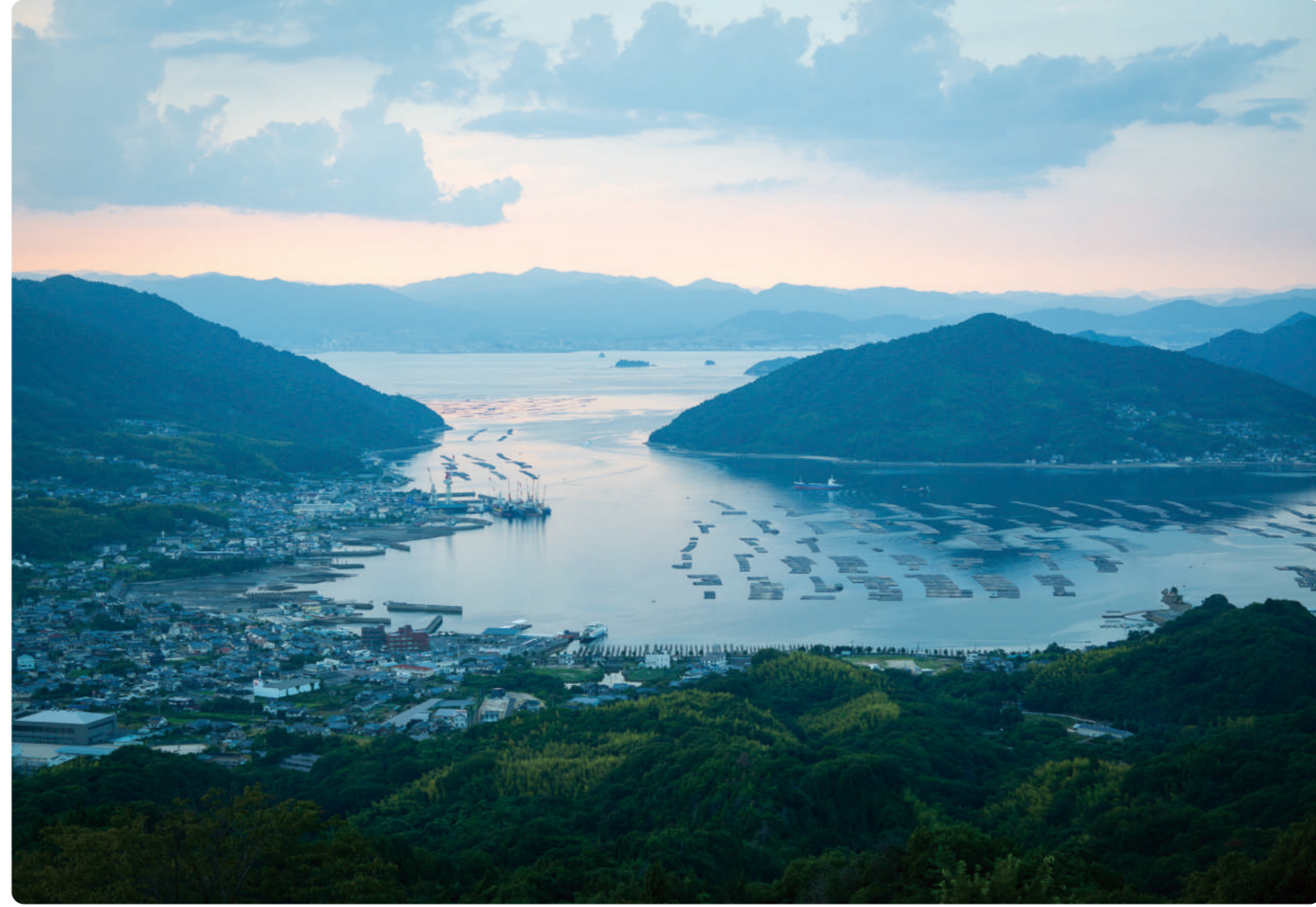
何度か足を運ぶと、必ず良さを見つけれられる島 ここで暮らしているからこそ見つけられる何でもない小さな発見が、日々を彩る 幸せなんだな 山田京子