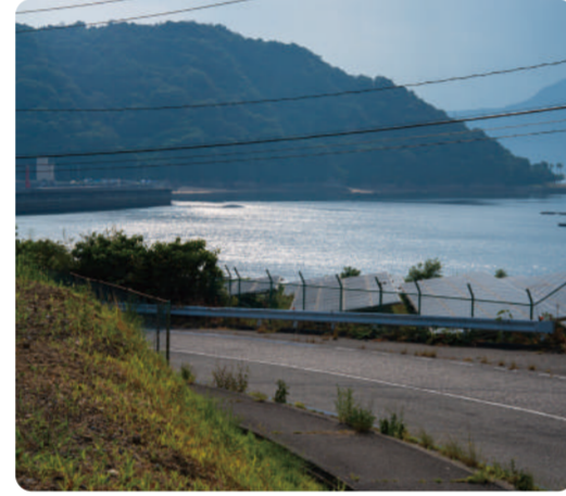
ああ〜めっちゃキラキラしとる... 前みて運転しよ!! あんこ食べマシーン みさきなおこ