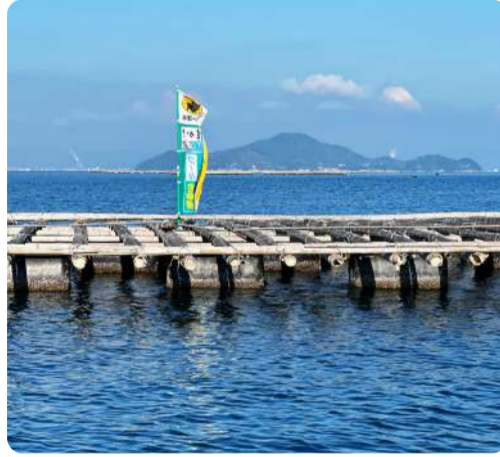
牡蠣の楽園（エデン）だよ 江田島市観光協会6年目 キッシー