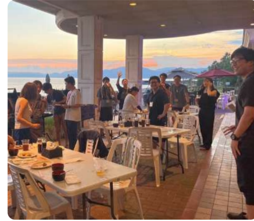
島の景色・食べ物・人柄で、来て もらった人に元気をもらった!!って 言ってもらえるんよ サウナに高確率で出沒：うっちー