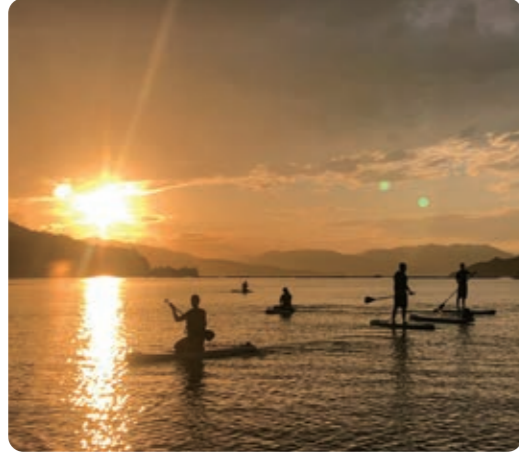
サップをしていると、きれいな夕日! これもえたじまん! 夕日のえたじまを、たくさん紹介! Rino