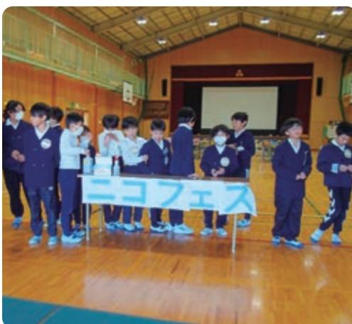
とても楽しかったニコフェス!! 今でも忘れることができない 最高の思い出!! もっと世界中の人と遊んでみたい!! 55葉かん