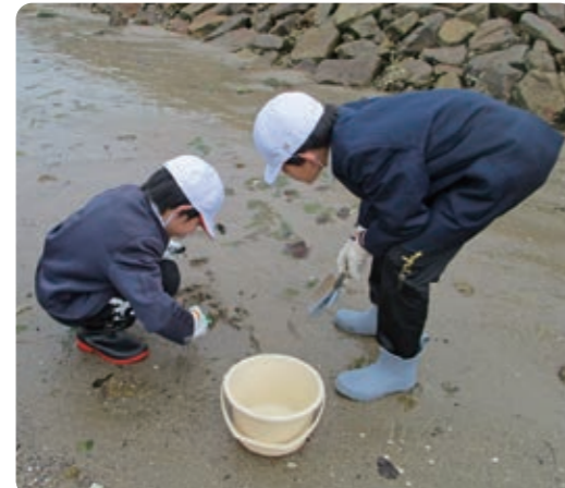
みんなでマテ貝を たくさんとって楽しい 長瀬海岸 初マテ貝採り 楽しい！ きゅうろう