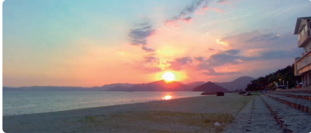
Uminosの温泉から見える夕日! 体も心も温まる えたじまを探して、紹介たくさんした 梨乃