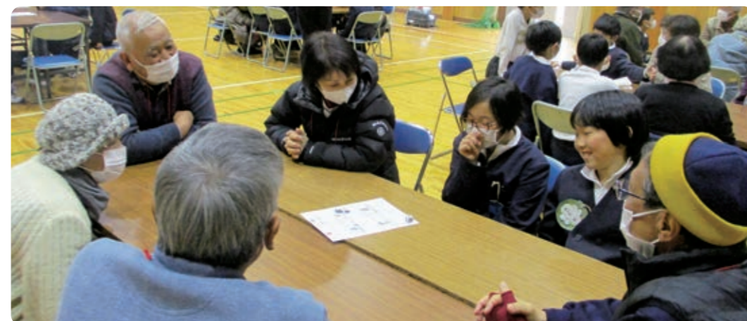
高齢者と楽しく 交流できる！ 中町小。 サッカー好きな中町っこ マモルン