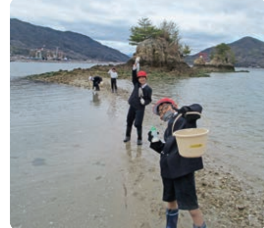
塩を入れたら マテ貝ビックリ! 面白い マテ貝 美味しい マテ貝 江田島の海は楽しい スバル