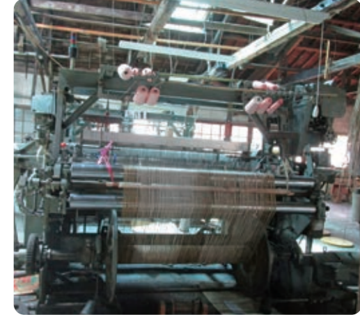
1度使ってみれば部屋がオシャレになるよ! 昔から使われている古いきかが沢山! バックが人気、つ島おり物。 江田島出身 キヤグが大好きで 面白い小学生 ゆうりんご