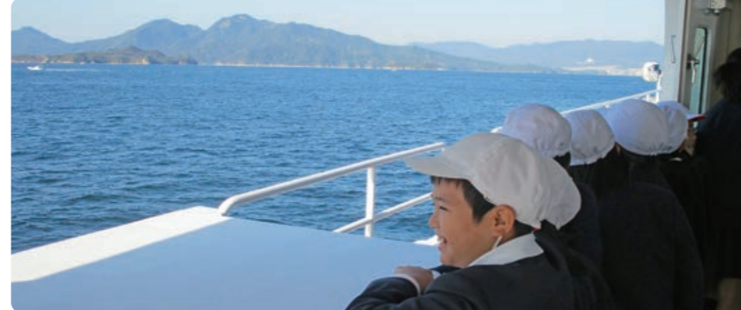
海から ながめる江田島市のけしき 最高!! キヤグが、大好きで面白い! 龍空