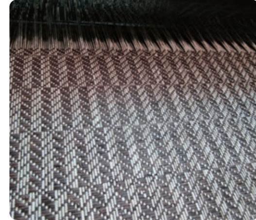
つ島おり物 高級品の財布やバック 日本に2カ所しかない紙布の工場 江田島出身オシャレが大好き小学生 ゆうり