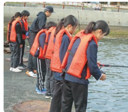
江田島市で釣り サバなどは春に よく釣れるよ 魚は新鮮で美味しいよ 釣り大好き KAISEN-DON