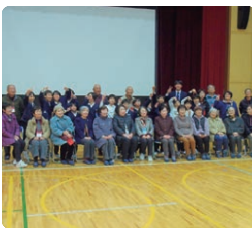
高齢者の人と、楽しく遊び、絆を深める ニコフェス！ ニコフェス超楽しい ユウダコ