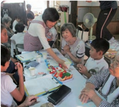
みんなで楽しく、笑顔で お話 仲良くなる、サロン交流。中町小!! もっとみんなと交流したい 一晟