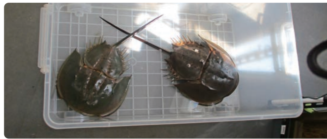
生きた化石 さとうみ科学館で発見！「カブトガニ」 フィリピン人 好きなこと：ピアノ アラカバ マラミュキ バルバー

この島の自然のこと。 この島の歴史のこと。 この島の食べ物のこと。 近所の名物おじさんのこと。 誰も知らない秘密の場所のこと。 すごく大きなこと。 ちょっぴりささいなこと。 島のことをよく知らない人はもちろん、 島のことをよく知っている人にも ついつい話したくなっちゃう 「えたじま」がきつとある。 今回は地域探究の授業の一環で 中町小学校のみなさんが思う 「えたじま」を教えてくださいました。 だれのものでもないこの島を、 だれのものでもある島にするために。 あなたの「えたじま」も、 聞かせてください。