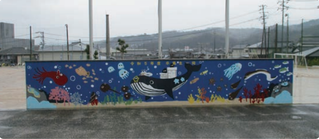
中町小学校出身の卒業生と令和5年度の6年生とのコラボ 江田島の海をイメージした、壁画 江田島出身、中町育ち リノ