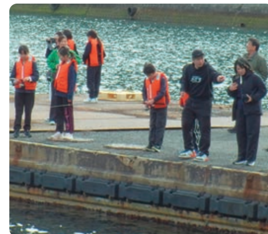
釣りはやってみると楽しい！ またやりたくなるよ、やってみて！ 江田島の海は楽しい！ 宝 大晴