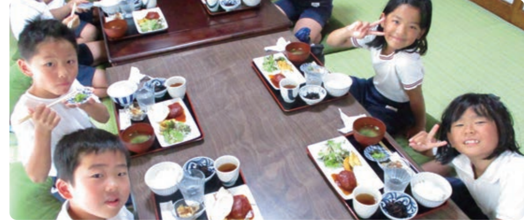
これ、全部江田島産じゃけえ美味しいよー! のらの定食 ゲーム大好き 江田島っ子 コトキ