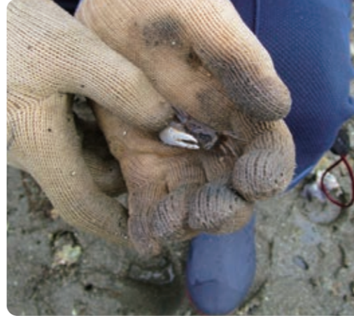
江田島市のじゅんぜつめつきぐしゅ ハクセンシオマネキ! キヤグが、大好きで面白い! 龍空