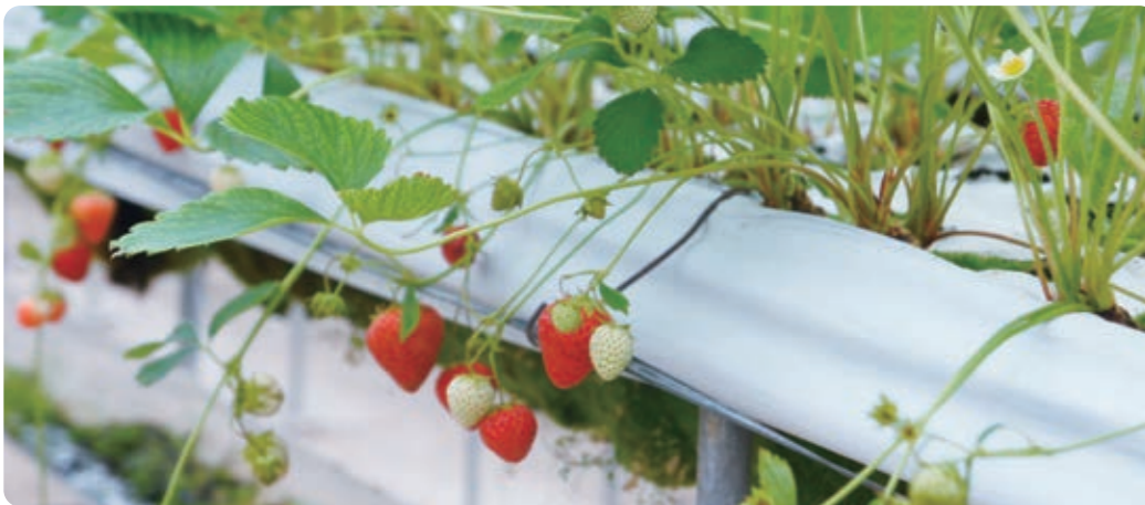
とても甘くて 美味しい いちご 沖美ベジタ いちご狩りのできる時期は3月～5月末まで（予約制） ゲーム好きな 尼子 麗歌