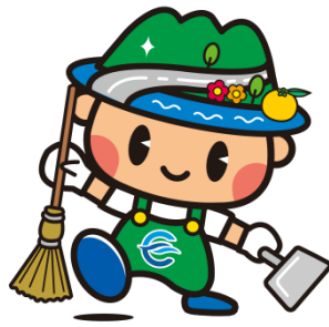
江田島市アダプト制度 マスコットキャラクター「アダプトくん」