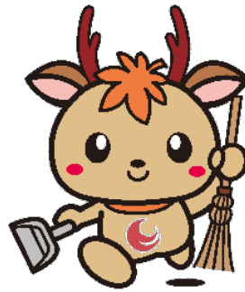
広島県アダプト制度 マスコットキャラクター「アダピィ」