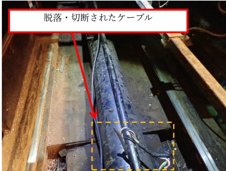
脱落・切断されたケーブル