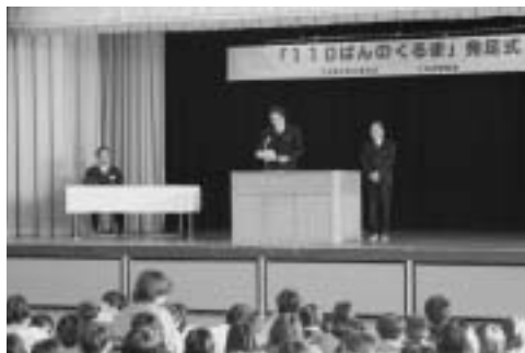
「110ばんのくるま」宣言

1月11日(火)、江田島小学校において「110ばんのくるま」制度発足式が行われました。式には関係機関・団体の他、市内の小・中学校の代表者が集まり、江田島市長(防犯連合会会長)あいさつ、「110ばんのくるま」代表者による宣言の後、江田島小学校の児童によって