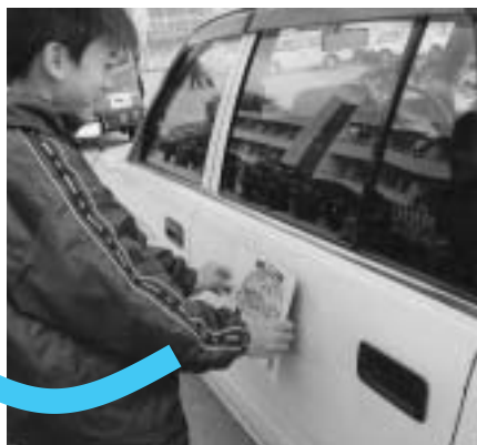
江田島小学校生徒による表示板の貼付