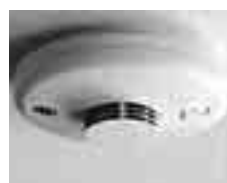
住宅用火災警報器 (実物)

このため法律が改正され、一戸建住宅や共同住宅の寝室などに住宅用火災警報器の設置が必要となりました。この警報器は火災の煙や熱などを自動的に感知して知らせてくれます。設置や維持の方法は、今後、江田島市火災予防条例で基準を定める予定です。