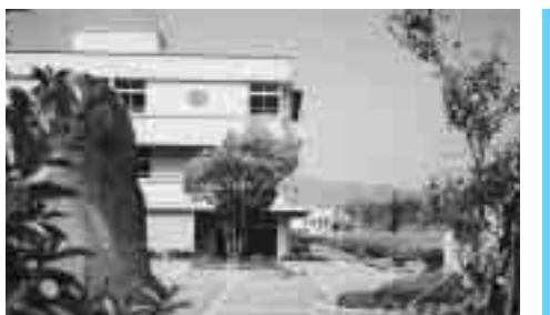
▲ 切串小学校 学級数 7 児童数 94人