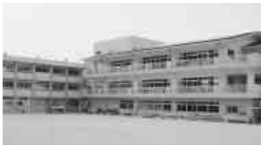
★ 三高小学校 学級数 6 児童数 80人

このたび、広報えだじま6月号から「市教委だより」のコーナーを新設しました。市民の皆さまに、学校教育や生涯学習に親しみと興味を持ってもらえるように、掲載していきます。 今回は、市内22の小中学校について紹介します。