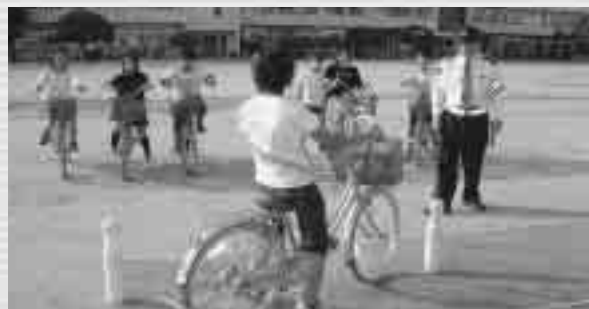
練習に励む児童のみなさん

出場する児童は、大会に向けて警察官の指導で、毎日練習して頑張り、大会でも練習の成果を発揮しました。