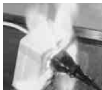
トラッキングによる発火

ことがあるのを「存知ですか? これは「トラッキング」と呼ばれ、差しっ放しにしているコンセントとプラグのすき間にほこりなどがたまり、長期間に渡って湿気を吸うことに