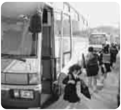
▶ バス通学する児童たち