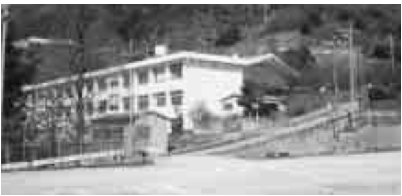
▲ 沖中学校 学級数 2 児童数 23人

教育目標 自ら考え主体的に生きる、心豊かで、心身共に健やかな生徒の育成 研究主題 生徒の心に響き、生徒自らが考えを深めていく道徳の授業を求めて、体験活動を含めた道徳資料の開発 指定校 道徳教育実践研究指定校（広島県教育委員会指定） 江田島市立学校研究指定校（江田島市教育委員会指定）