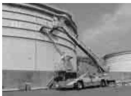
事業所の危険物災害訓練