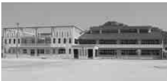
▲ 大古小学校 学級数 7 児童数 177人

教育目標 自ら学ぶ子どもの育成 ○ 生き生きと活動する子ども ○ 進んで考える子ども ○ やさしく助け合う子ども ○ 最後までやりぬく子ども 研究主題 かかわり合う中で、考える力を引き出す指導の工夫 指定校 理数大好きモデル地域事業（独立行政法人科学技術振興機構指定） 江田島市立学校研究指定校（江田島市教育委員会指定）