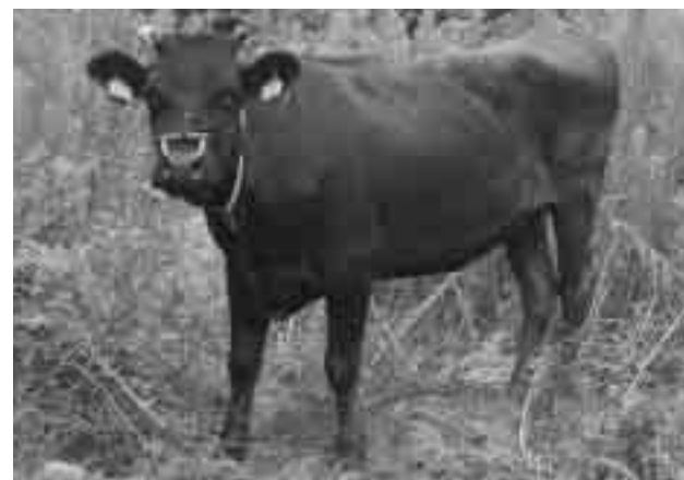
↑イノシシ退治に協力する出前牛

本紙7月号(第9号)に掲載した「イノシシ退治のススメ」。 その中で、イノシシ対策として挙げた牛の放牧を、一部の地域で試験的に始めました。その効果などについて紹介していきます。