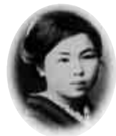
金子みすゞ ／本名 金子テル

明治36年(1903年)山口県大津郡仙崎村(現長門市)に生まれる。大正末期、数々の作品を発表。西條八十に『若き動揺詩人の巨星』と称賛されながら、昭和5年(1930年)26歳の若さでこの世を去る。没後その作品は散逸。幻の童謡詩人と語り継がれるが、矢崎節夫(童謡詩人)の長年の努力で遺稿集が見つかる。優しさに貫かれた詩句の数々は、今日、高く評価され人々の心を魅了してやまない。