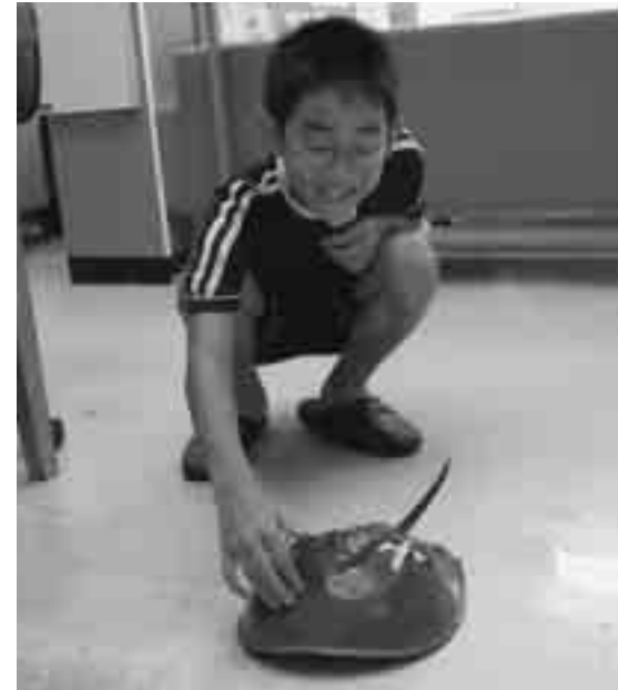
恐る恐るカブトガニに触れてみます