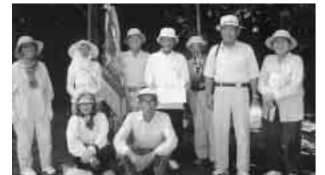
優勝した高祖(沖美町)の皆さん。