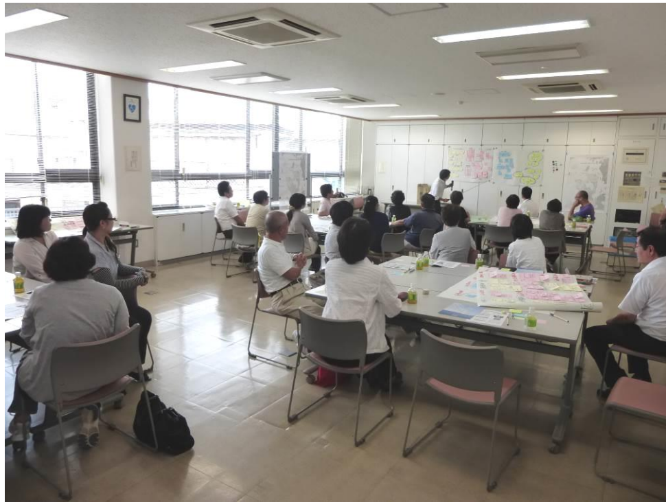
江田島地域での作業風景