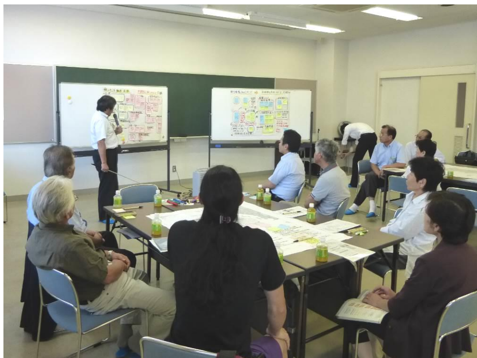
沖美地域での作業風景