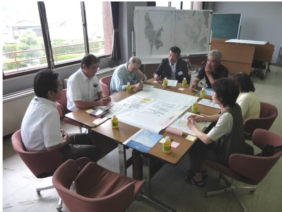
能美地域の作業風景