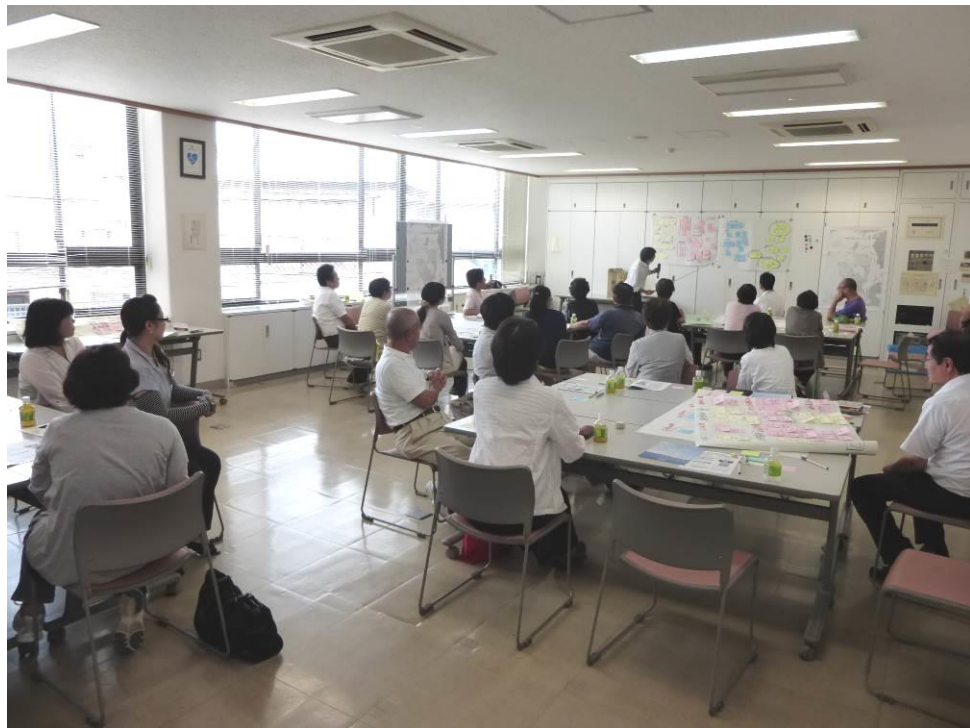
江田島地域での作業風景