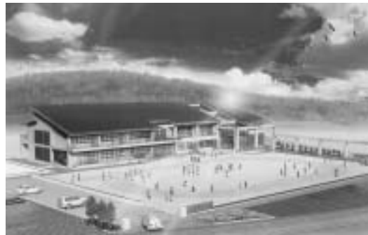
鹿川小学校完成予想図

能美町の鹿川小学校の校舎改築工事を、5億8,800万円を古澤建設工業株式会社（江田島市大栴町小古江）と請負契約することに同意しました。 工期は、来年2月20日までで、来春卒業する児童が少しでも新校舎で過ごせるよう早期完成を目指しています。