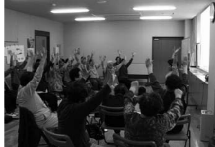
この教室では健康体操など実施

体の衰えは、「老化」ではなく「運動不足」からと考えられます。加齢とともに何もしなければ日々筋力、体力が衰えてきます。足腰が弱って、外出の機会が減ってくると介護が必要となる危険性が増します。地域の中で元気に今の生活が維持出来るように、市では介護予防教室を実施しており、5月以降も次のとおり行っていきます。参加を希望される人は、地域包括支援センターへお申し込みください。