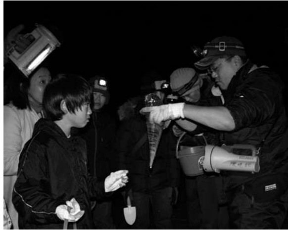
自然観察会の実施

市民全体を対象に、自然科学を題材とした野外観察会・研修会・展示会などを開いています（毎月1～2回）。また、大学の研究室スタッフによる研修会などを開き、先端の科学や知識にふれる機会もつくっています。