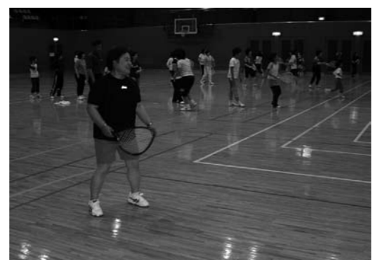
▲平成18年度スポーツセミナーの様子