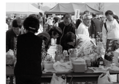
特産品販売にも多くの人