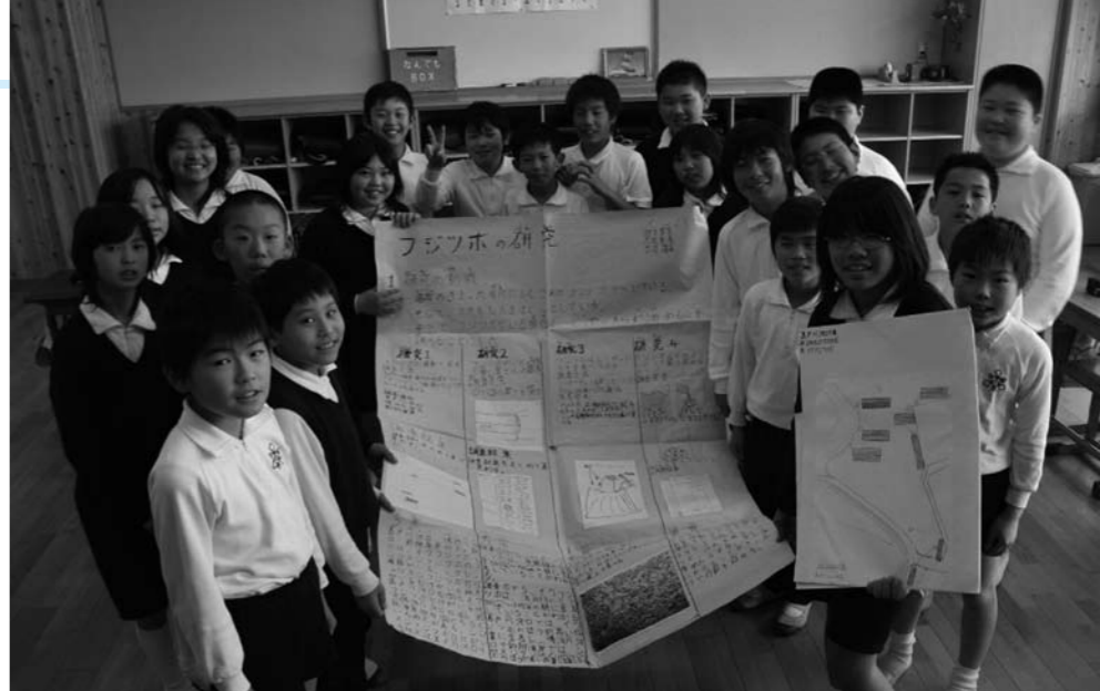
大古小学校6年生の皆さん。明るい雰囲気笑顔が絶えない