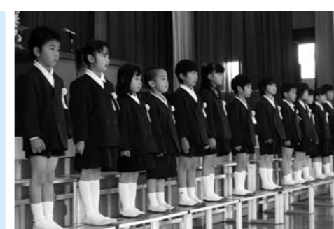
鹿川小学校でのひとこま

4月6日(金)、市内各小・中学校で入学式が行われ、小学校児童169人、中学校生徒190人がそれぞれの学校に入学しました。統合後、初となる鹿川小学校では新1年生13名、江田島小学校では40名が入学しました。江田島小学校では、6年生が