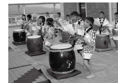
小用小3・4年生の子どもたちによる太鼓の演奏