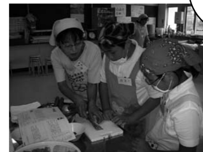
学校の授業で調理実習を行いました