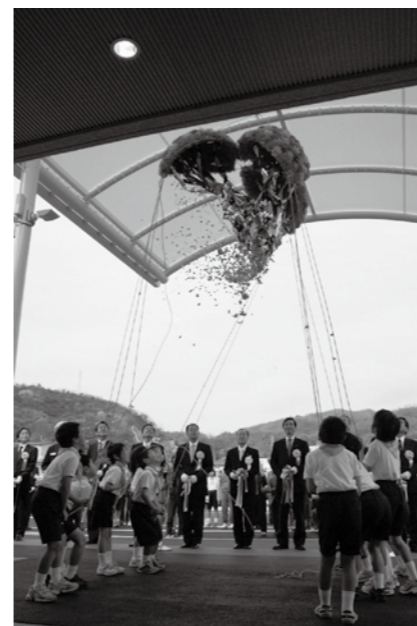
小用小1・2年生のくすだま割りで完成を祝いました