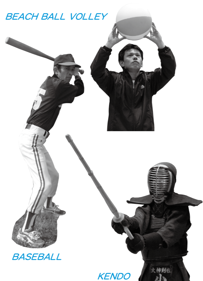
BEACH BALL VOLLEY