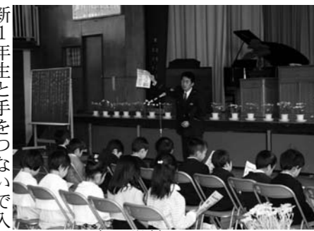
江田島小学校でのひとこま