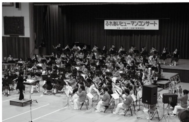
合同演奏ではオーケストラ並みの迫力が