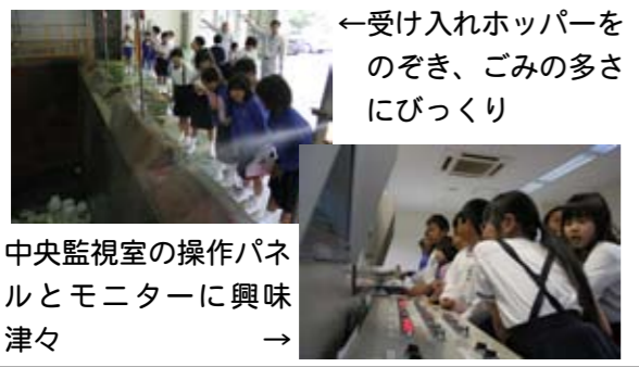
←受け入れホッパーへのぞき、ごみの多さにびっくり

ごみへの意識を高めようと、学校ではいろいろな取り組みを行っています。柿浦小学校の4年生は、社会の授業で4月27日(金)にごみ収集を、5月10日(木)にリレーセンターを見学しました。見学後、子どもたちは「ごみがこんなにたくさんあるとは思わなかった」「出すごみを少なくしないとイケない」と感想を話していました。