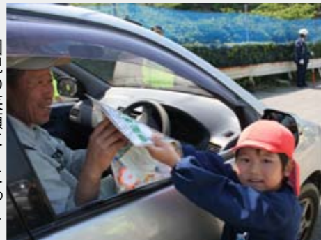
園児の笑顔に にっこり

5月11日(金)、春の交通安全運動にあわせて、江田島町鷲部三丁目付近の県道で交通安全テント村が開村されました。今回は、江田島保育園園児11人と交通安全協会会員が参加。道行くドライバーに「交通安全気をつけてね」と声をかけながら、PRグッズを渡しました。