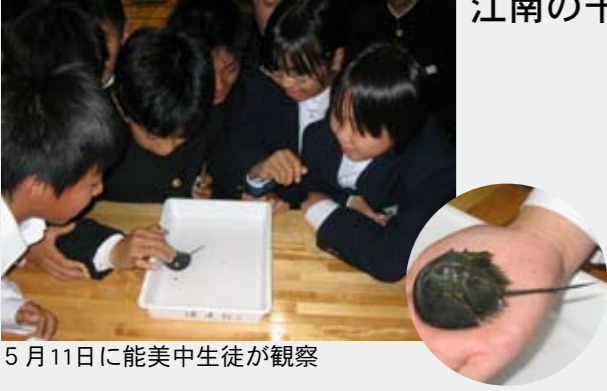
5月11日に能美中生徒が観察