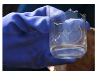
ガラス製のコップは燃えないごみに分類されます

間違えやすいガラスやコップ別の日に、ビン・カンの収集現場へ。粗大ごみの日と同じく、午前8時から収集を始めました。置いてあったごみはいったんパッカー車に積み込み、不適合がないか調べます。すると、ハンガーや陶器を発見。これらは別のごみ袋に入れて保管しました。「ビンやカンに交じっていることが多いのは、ガラス製のグラスやコップです。ビンと間違えやすいので、知らずに出している人もいるのではないのでしょうか。」と収集業者は話します。 危険と隣り合わせの作業 パッカー車の後ろには操作ボタンがついており、それを