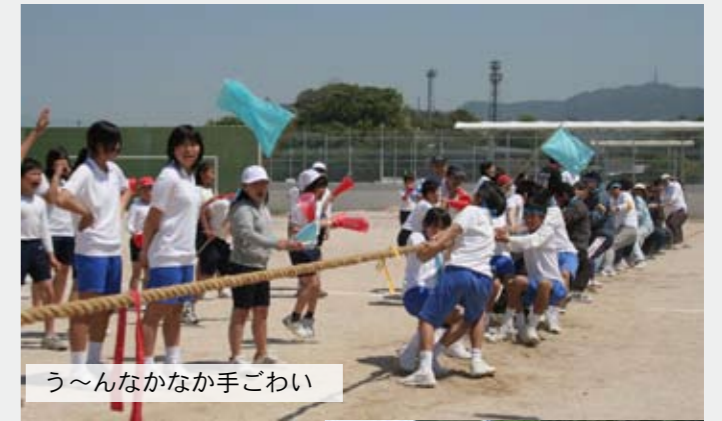
う～んなかなか手ごわい