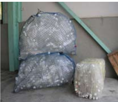
→ ネットで運ばれてきたペットボトルは、おおよそ2袋（左）で1ブロック（右）に圧縮

現在、環境センターが直面している課題は、運ばれたごみに対する残査量をできるだけ少なくすること。現在、運び込まれたごみの約30%が残査になっていますが、これを