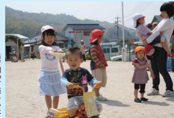
保育園って楽しいな

5月11日(金)、春の交通安全運動にあわせて、江田島町鷲部三丁目付近の県道で交通安全テント村が開村されました。今回は、江田島保育園園児11人と交通安全協会会員が参加。道行くドライバーに「交通安全気をつけてね」と声をかけながら、PRグッズを渡しました。