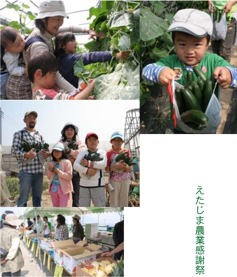
立派に育った自然の恵み