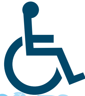
車いすマーク (国際シンボルマーク)