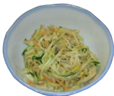
カレーマヨサラダ