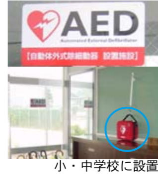
小・中学校に設置