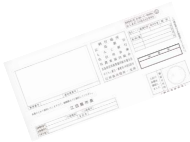
本年度の税率と納期

本年4月から後期高齢者医療制度が実施されました。これにより、0歳〜74歳の医療保険加入者は、後期高齢者医療制度を支援するため、後期高齢者支援金を含めた納付が必要となりました。 国民健康保険税も従来の医療保険分と介護保険分に加え、後期高齢者支援金を納付することになります。 なお、昨年度の医療保険分の税率と、本年度の医療保険分と後期高齢者支援金を合算した税率は変わりません。