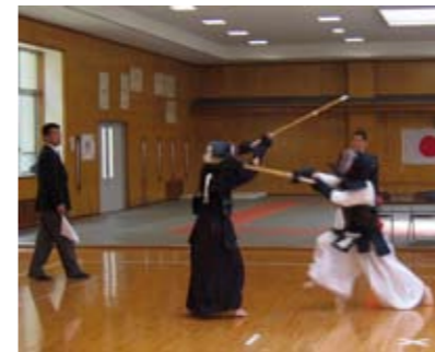
総合体育大会の様子

5月17日(土)に江田島市総合運動公園などで行われた第4回江田島市中学校春季総合体育大会の大会結果をお知らせします。