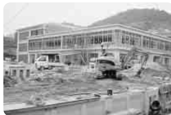
▲ 建設中の新江田島中学校

江田島中学校が、平成20年9月1日に現在地から小用小学校跡地に新築移転することによる。 新住所 江田島市江田島町小用 一丁目13番1号