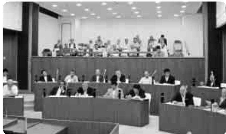
▲ 定例会開会中の議場

平成20年第3回定例会は、6月18日に招集され、27日までの10日間の会期で開かれました。 初日の18日には、市長の市政報告及び議長報告があった後、2日間にわたって11人の議員が一般質問を行い、市政全般について市当局の考えをただしました。 6月19日には、繰越明許費に関する報告4件、専決処分報告と承認2件、ふるさと寄附条例、ふるさと応援基金条例及び江田島市立学校設置条例の一部改正と補正予算案など10議案について審議を行い、いずれも原案どおり可決しました。 次に、議員発議による意見書(案)4件を可決し、散会しました。