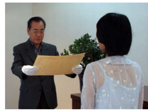
授賞式で賞状を渡す曾根市長