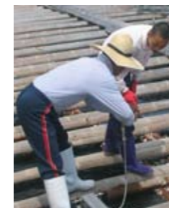
キャリア・スタート・ウィークのひとこま

江田島中学校落成式 新校舎完成に伴い、8月27日(水)に落成式が行われました。第2学期から、江田島中学校生徒は、新しい校舎での学校生活を過ごしています。