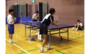
斜線は該当者なし