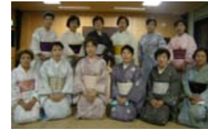
暁美会 演目「新舞踊」 曲「じょんがら別れ唄」

平成16年度大会に出場して以来の出場になります。大会を目前に控え、メンバー1人が出場できなくなりとても残念ですが、5人力を合わせて頑張ります。今回は、神野美伽さんの曲で踊ります。生きのいい踊りで会場をわかせてきます。メンバーも募集中です。