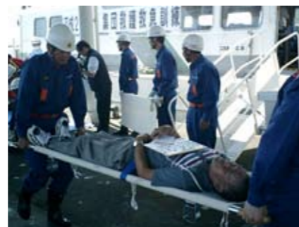
傷病者を搬送する消防団員

定で、海上自衛隊第1術科学校や安芸地区医師会江田島ブロック会など13機関120人が参加しました。負傷者に対しては、病院搬送順位を決めるトリアージ(判定)を行い、現場に医師を派遣し迅速な対応を図るなど、実際の現場さながらの緊