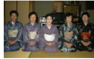
県民踊沖美是長支部 演目「新舞踊」 曲「日本の男」

出場が決定し、毎日の練習に力が入ります。第9回大会に最優秀賞を受賞したほか、優秀賞を数回受賞した経験もあります。今回の演奏曲はテンポも速く、みんなて息を合わせて弾くのが難しいですが、とても好きな曲です。なんとか入賞できるよう頑張ります。