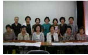
琴城流大正琴ひまわり会 演目「大正琴」 曲「夢想花」

出場が決定し、毎日の練習に力が入ります。第9回大会に最優秀賞を受賞したほか、優秀賞を数回受賞した経験もあります。今回の演奏曲はテンポも速く、みんなて息を合わせて弾くのが難しいですが、とても好きな曲です。なんとか入賞できるよう頑張ります。