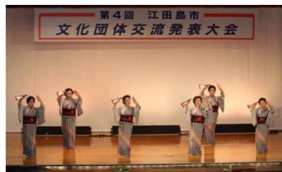
昨年の発表大会の様子

日時 6月21日(日) 午前9時40分開会・午前9時50分開演(閉会は午後3時) 場所 農村環境改善センター(能美町鹿川2011番地2)