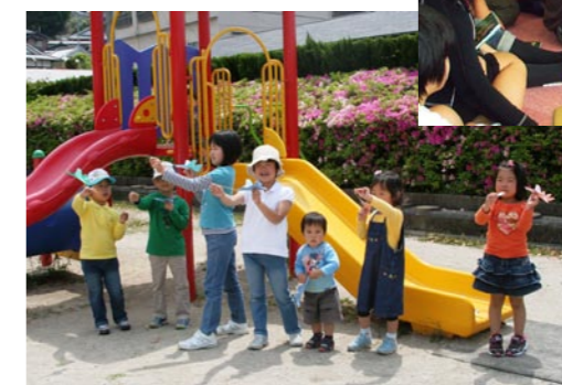
←江田島図書館での紙ひこうき大会の様子。