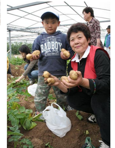
たくさんジャガイモが採れました。