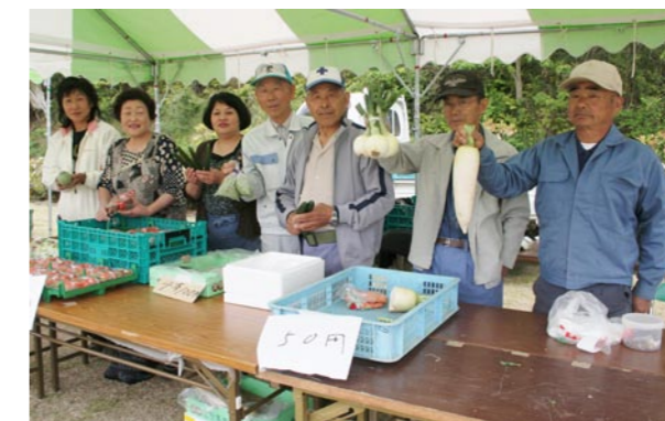
会場では地元で採れた新鮮な野菜などを販売。

当日はキュウリのもぎとり・地鶏の卵拾い・ジャガイモ掘りの体験や、新鮮野菜の販売、ビンゴゲームなどが行われ、大勢の人でにぎわいました。