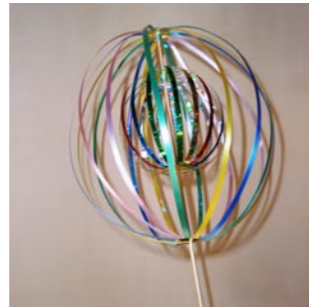
くるくるレイン棒の完成品

希望者は購入も可能 「京兆書日記」を翻訳・発行 大柿歴史資料館では、館内に所蔵する古文書を誰もが読める形にして残すため、古文書学習グループ「翻訳の会」の協力により、今回は「京兆書日記」を取り上げ、代々医師の家系へ入門して医師免許を得るためにかかわった人物との間で交わされた往復書簡を中心に翻訳しました。 希望者は購入することもできます(B5版 一冊500円)。詳しくは、大柿歴史資料館 ☎(57)6420へ。