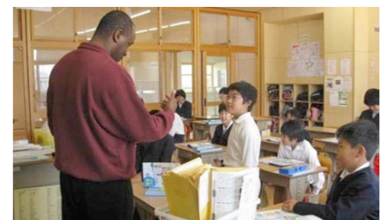
鹿川小学校の授業風景

浦小学校では「豊かな心を育てる体験活動事業」(広島県指定)により、2泊3日以上宿泊体験学習などを通して、体験活動を行います。