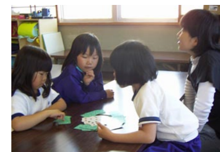
みんなで和気あいあいと楽しんでいます。