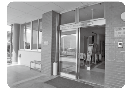
▲宮ノ原交流プラザ