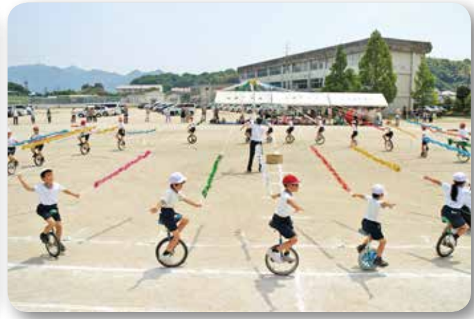
▲切串小学校運動会（江田島町）