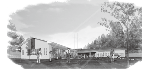
▲沖美市民センター完成予想図