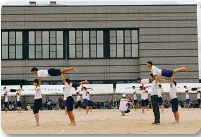
▲能美中学校運動会（能美町）