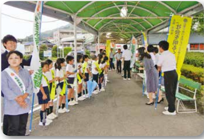
▲三高小・中合同あいさつ運動（三高港）（沖美町）