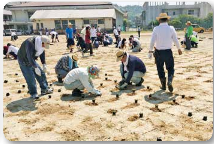
▲大柿高校グラウンド芝生植栽作業（大柿町）