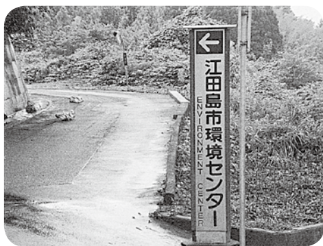
▲環境センター（沖美町）

市長 建設予定地の地権者との話し合いは用地取得を終らせる予定で作業が進められています。