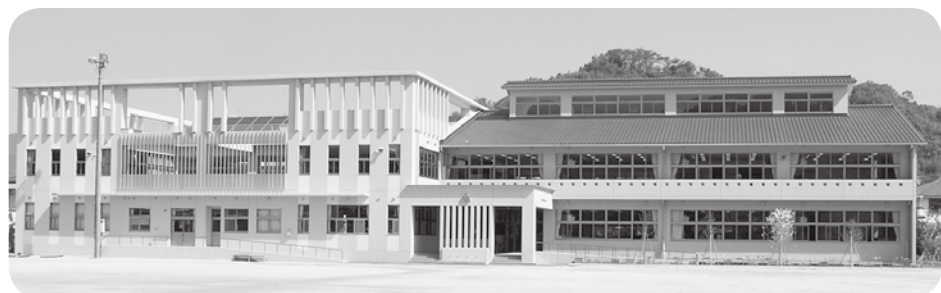
▲大古小学校（大柿町）

市長 本年2月に中町公民館で「婚活パーティー」を開催し、男性21名、女性24名の参加がありました。本年度も計画しており、新たな若者定住促進事業に取り組めるよう検討したいと考えています。