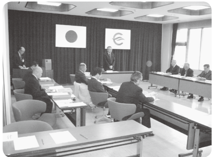
▲市行財政改革審議会

教育長 江田島市の学校教育においては、21世紀を主体的に生きる心豊かな子どもへの育成のために、知育・徳育・体育のバランスのとれた教育を推進しています。知育に関しては、県や全国の学力調査における結果から言えることとして、基礎的、基本的な知識や技能については、概ね理解が図られておりますが、知識・技能を活用する力には課題が見られます。