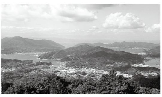
今後も“ふるさと江田島”への温かい応援をお待ちしています。

平成22年度中は、計8件で201万4000円のふるさと寄附金をお寄せいただきました。平成20年度の制度開始以来、計35件で641万7000円をいただいています。ご支援ありがとうございます。 お寄せいただいたふるさと寄附金は、「江田島市ふるさと応援基金」に積み立て、皆さまのご期待に応えられるよう、活力あるふるさとづくりに活用させていただきます。