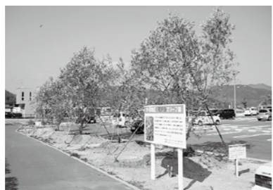
①小用地区 (小用ターミナル駐車場)