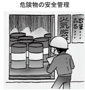
平成23年度 危険物安全週間推進標語 「危険物 無事故のゴールは 譲れない」

危険物は、ガソリンスタンドや特定の事業所にだけあるわけではありません。一般家庭にも灯油やスプレー缶など、たくさん危険物があります。くれぐれも取り扱いにはご注意ください。