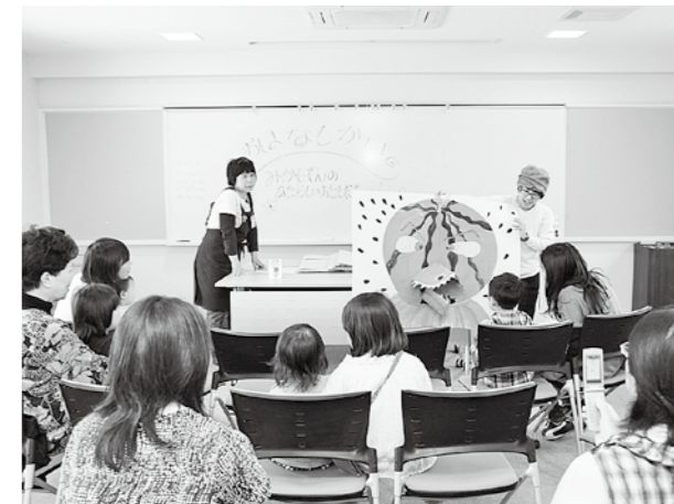
(能美図書館) 仕掛けつきの大型絵本にびっくり