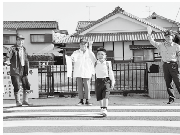
(沖美町三高地区) 登校中の児童に街頭指導

当日は、鷲部公民館を出発して、区の神社を経由した区内1周コースを約1時間半かけて歩き、周りの景色を楽しみました。