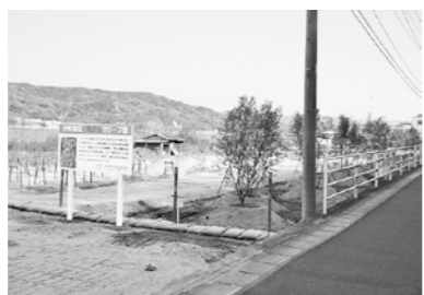
②中町地区 (県道沿い)