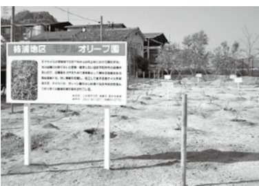
③柿浦地区 (柿浦港埋立地)