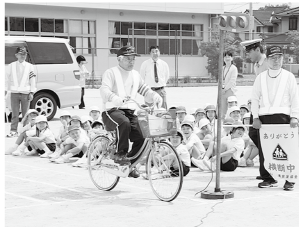
(大柿町大古小) 児童に自転車の乗り方を実演