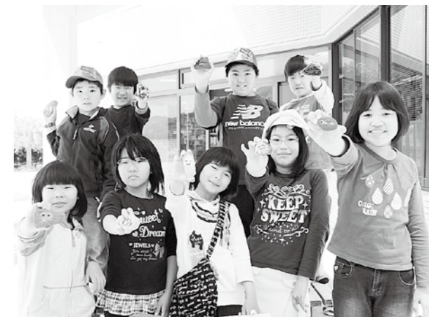
(江田島図書館) 小石に魚の絵を描いたよ!