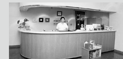
フロントは2階です。

和室(10畳・定員5人) 2部屋 和室(8畳・定員4人) 8部屋 洋室(ツイン) 3部屋