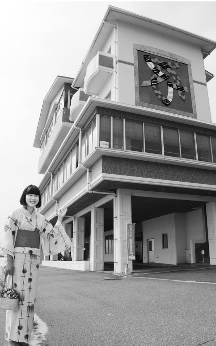
2階にレストランや宴会場など、3階に客室、4階に客室と大浴場があります。施設の前には砂浜が広がり、今年は7月16日(土)から海水浴が楽しめます(駐車場有料)。