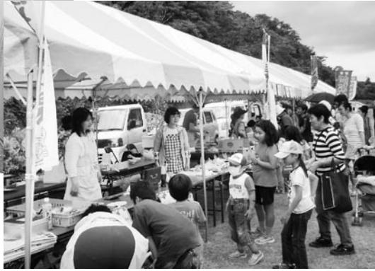
会場では、採れたての新鮮野菜→を販売しました。