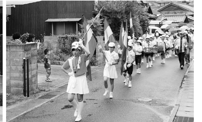
【6月10日(金)】柿浦小学校 雨にも負けず、音を響かせていました。

飛渡瀬小と柿浦小児童が、交通安全の鼓笛パレードを行いました。パレードには、交通安全協会会員なども参加。児童が太鼓やキーボードなどを演奏しながら学校周辺を歩き、交通安全を呼び掛けました。