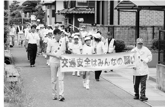
【6月8日(水)】飛渡瀬小学校 福祉施設や保育所でも演奏を披露しました。

旧沖小学校付近の水田にちびっこが集結。当日はあいにくの雨模様となりましたが、子どもたちは元気に田植えをしました。