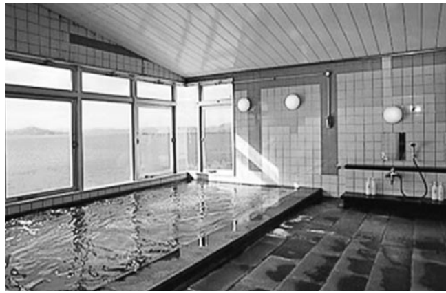
4階にある大浴場からの眺めは絶景です。