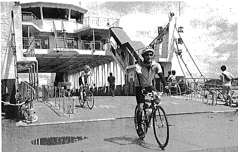
切串港に到着したフェリーから下り立つサイクリスト

同連合会の森藤幹二専務理事は「広島港からのパス利用者の9割以上が江田島行き。航路を利用した島のサイクリングを後押ししていきたい」と意気込んでいる。(加茂孝之) 〓おわり