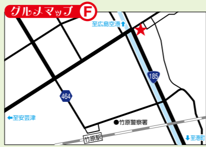
JR竹原駅から徒歩15分 芸陽バス「道の駅たけはら」バス下車

◎ランチ11月:黒鯛の詰め物焼きコース ……1,980円(税込) ◎ランチ12月:黒鯛のポワレコース ……1,980円(税込) ◎ランチ1月:黒鯛の蕪蒸しコース ……1,980円(税込)