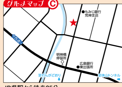
JR呉駅から徒歩25分 広電バス辰川線「明神橋」から徒歩3分

◎ピッツァ オラータ……2,000円(税別) ※クロダイ・タマネギ・アンチョビ・モッツアレラ・オレガノ(チーズベースorトマトソース)選択可能