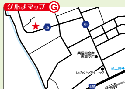
JR忠海駅から徒歩8分