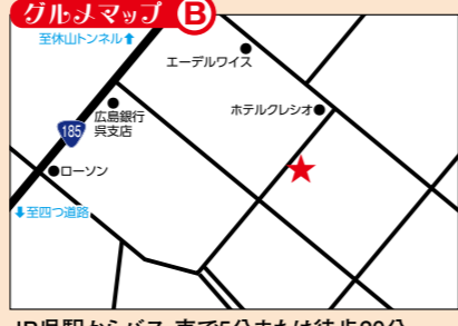
JR呉駅からバス・車で5分または徒歩20分 【呉本通3丁目】バス停から徒歩1分