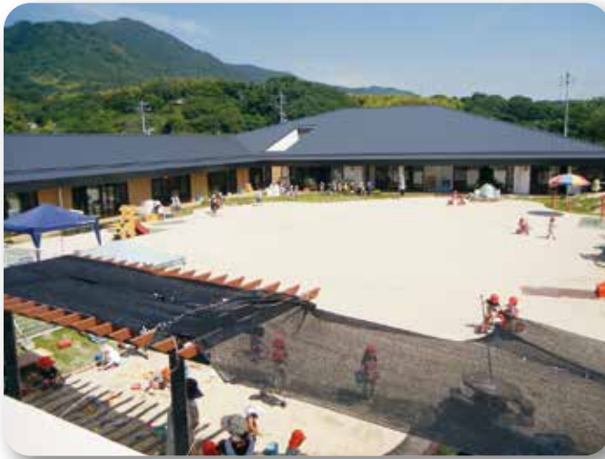
▲完成した認定こども園のうみ（能美町）