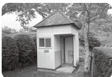
▲汲み取り式の公衆便所(福連木公園)

今後は、平成30年度に策定した公園等管理活用計画に基づく公園の再編整備をはかっている中で対応します。