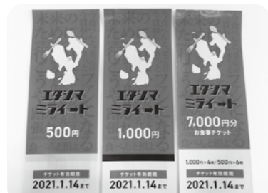
▲ミライートチケット(見本)

浜西 長引く新型コロナウイルスの影響で市内の事業者が疲弊している。スピード感を持って対応していただきたい。