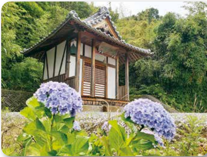
▲河内観音堂とアジサイ（大柿町）