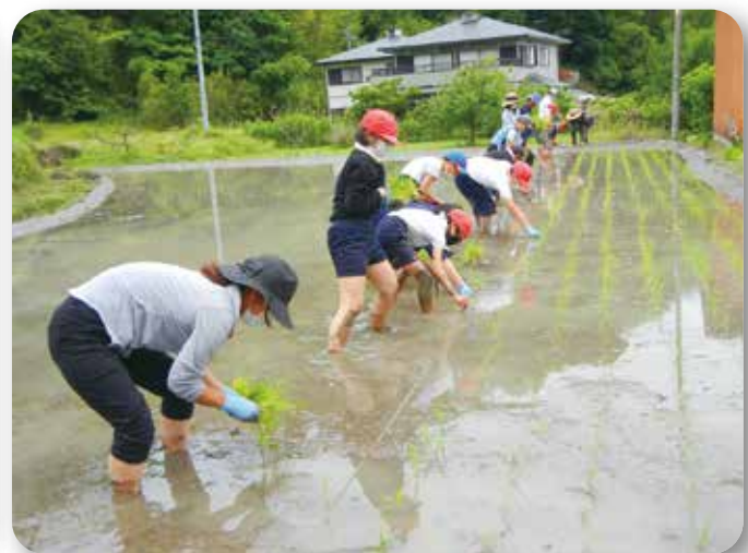
▲学校田での田植え（沖美町：三高小学校）