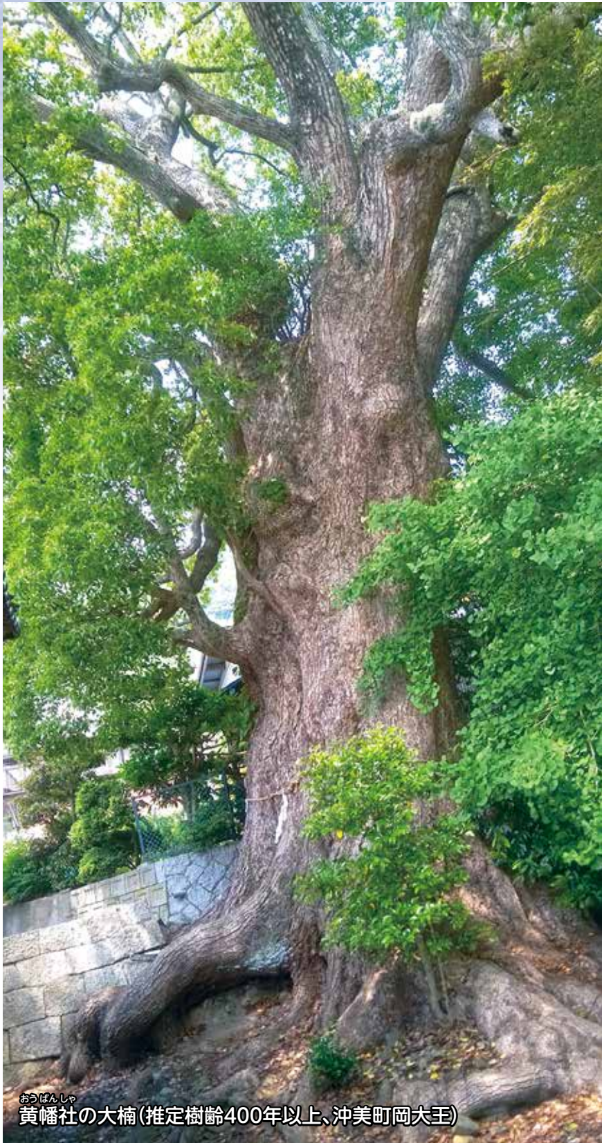
おうぼんしゃ 黄幡社の大楠(推定樹齢400年以上、沖美町岡大王)