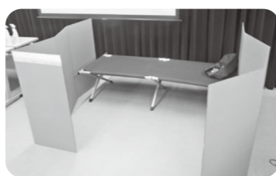
▲段ボール間仕切りと簡易ベッド