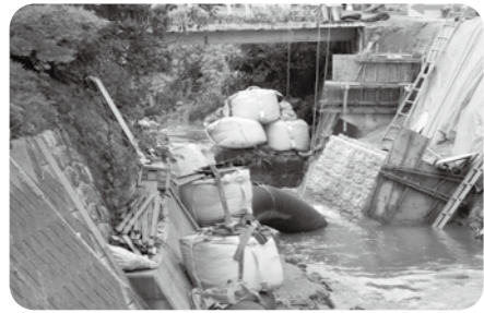
▲復旧中の木下川（大付・古戸付近）

市長 市民の生活に影響が大きい情報は、防災行政無線による放送や、チラシ配布、ホームページ掲載など多様な伝達手段を活用し周知に努めます。