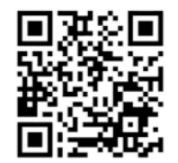
江田島市地域おこし協力隊 QRコード