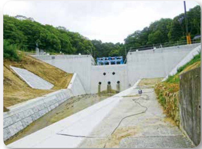
▲工事が進む大歳神社付近の砂防えん堤（江田島町切串）