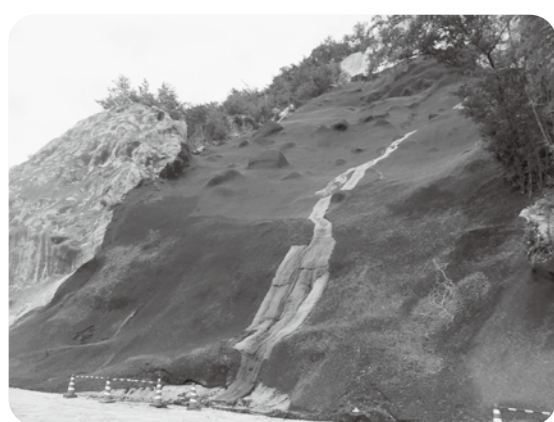
▲工事が進む市道宮ノ原～幸ノ浦線に隣接する斜面