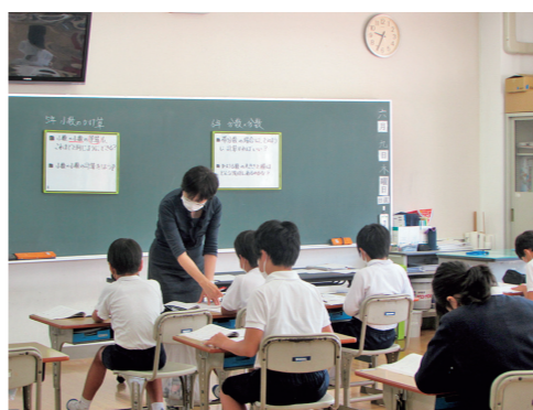
イエナプラン教育を試行した三高小学校