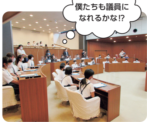
議員席に座る小学生

市内小学6年生を対象に市議会を身近に感じ、政治に関心を持ってもらえるよう議場等の施設見学や議会に関するクイズ、議員に対する質問タイムを設けました。