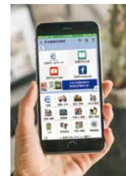
江田島市公式LINEスタート