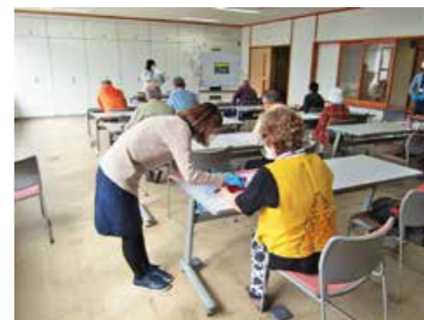
市民向けスマホ教室