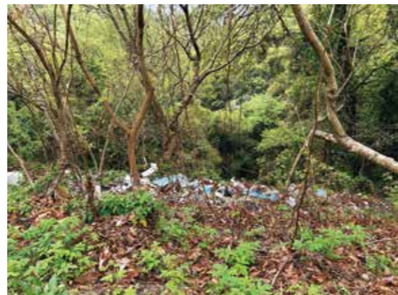
人目につかない市道沿いの不法投棄の状況