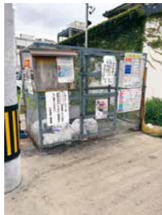
監視カメラの設置による不法投棄抑止の効果を確認