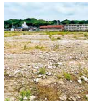
敷地内の地面の様子