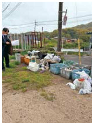
収集日以外のごみが日常的に出ている状況