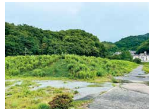
敷地内に残された盛り土