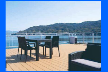
テラス横の建物でオリジナルのドリンクやスイーツ販売