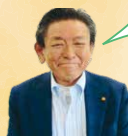
おき やすし 沖 也寸志