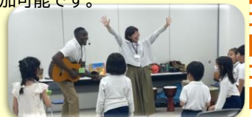
みんなで楽しく英語を学ぼう!