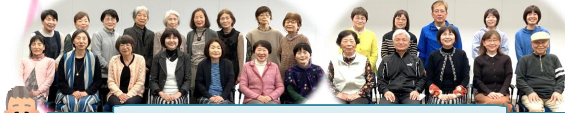
ペン・毛筆細字講座の皆さん 毎月第2・4月曜日【午前の部】9時~11時【午後の部】19時~21時