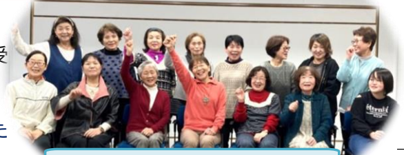
コーラス講座の皆さん 毎月第1・第3土曜日 9時30分~11時30分

大柿厚生文化センター主催事業のコーラス講座と、ペン・毛筆細字講座が4月よりスタートしました。受講生の皆さんは講師の指導を受けながら、それぞれの講座で熱心に取り組まれています。