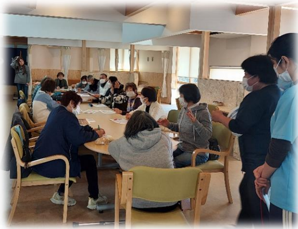
こうれいしゃ しょくじ かんけい がくしゅう さんかしゃ 高齢者と食事の関係を学習する参加者