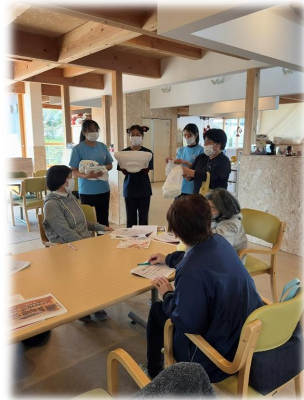
かみ とくせい 紙おむつの特性を説明するウェイさんたち