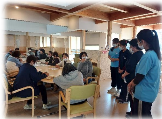
交流資料を見て学ぶ参加者