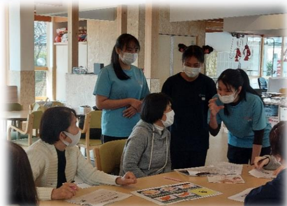
家族への接し方について質問する参加者