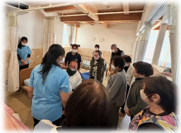
ベッドから 移動 させ たいけん さんかしゃ ベッドから移動させる体験をする参加者