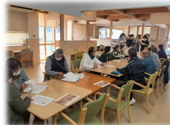
紙おむつの種類を実際に見る参加者