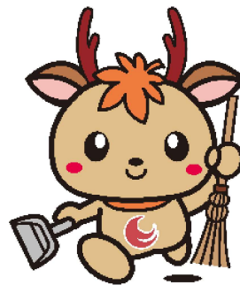
広島県アダプト制度 マスコットキャラクター「アダピィ」