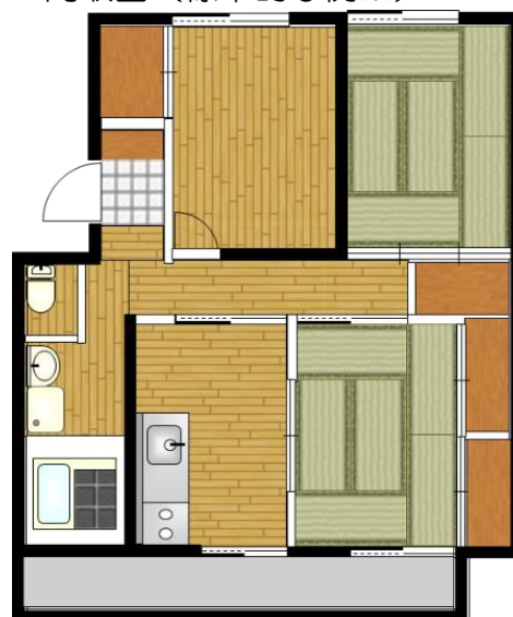
間取図（標準的な例※）