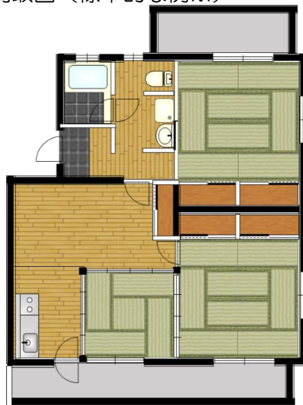
間取図（標準的な例※）