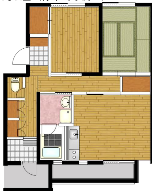
間取図（標準的な例※）