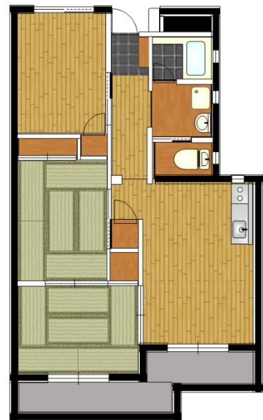
間取図（標準的な例※）