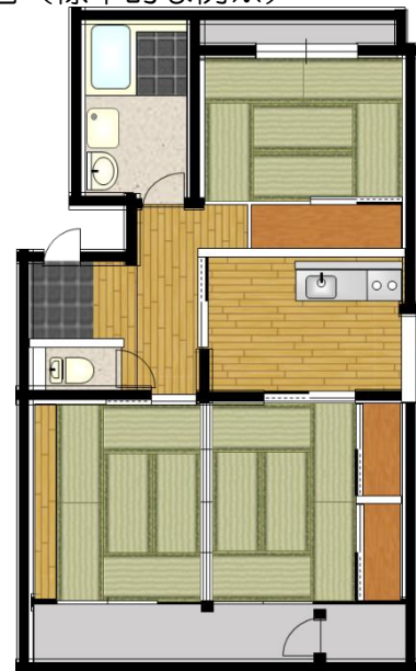
間取図 (標準的な例※)