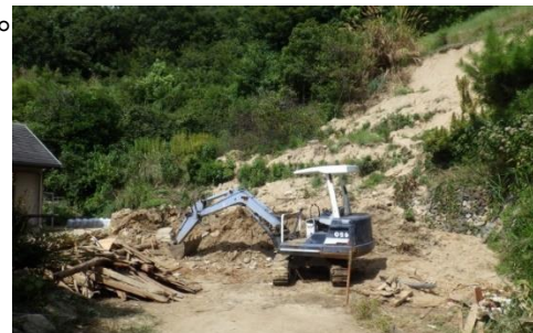
斜面崩壊・被災状況（H30年7月）