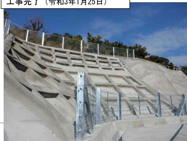
工事完了（令和3年1月25日）