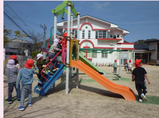
▲認定こども園複合遊具改修工事