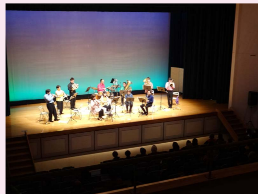
▲コンサート開催運営費