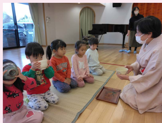
▲特色ある保育事業、世代間交流事業