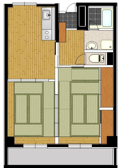
間取図（標準的な例※）