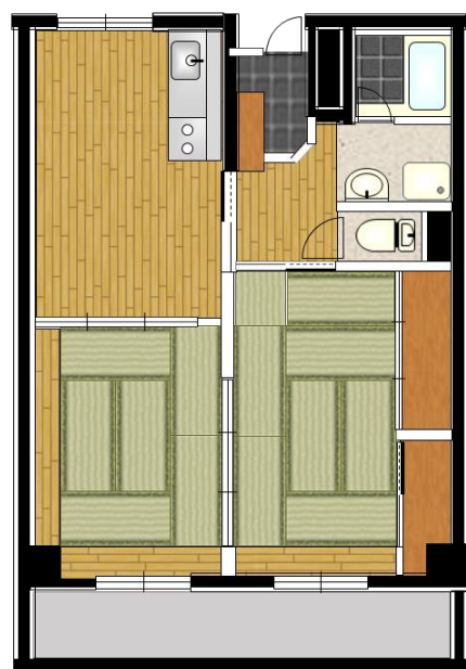
間取図（標準的な例※）