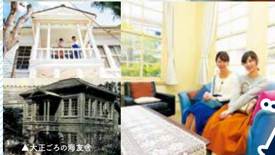
▲大正ごろの海友舎