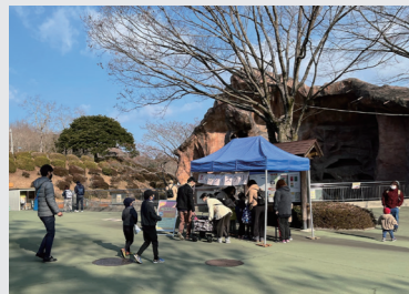
↑クイズラリーの様子→飼育係が描いたワンポイントまんがが解説板