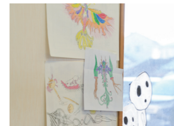
おひさま2号館には、子どもたちが自由な発想で描いた繊細で色鮮やかな絵も。

自分には関係ないという人も多くいるだろう。しかし、太陽が運営する各施設は、ただの障がい者支援施設ではなく、障がいを受け入れ『個性』として人へ働きかけるきっかけの場所、人と何かをすることが楽しいと思えるような場所であるのではないかと思った。皆さんの話を聞き、私自身、障がいとの向き合い方を改めて考えさせられたのは言うまでもない。