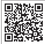
↑売却物件カタログはこちらから

☎政策推進課 ☎0823-43-1631 4月1日から、市有不動産の売却価格を改定します。大幅値下げになっている物件もありますので、この機会に購入をご検討ください。 物件カタログは、政策推進課 (本庁3階) などに置いてあります。また、市ホームページでもご覧になれます。