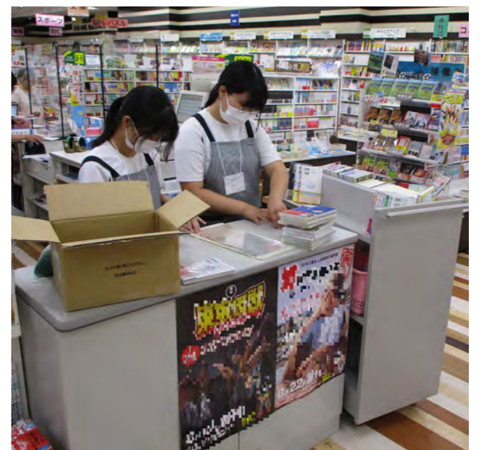
▲書店にて、配達商品の確認作業を体験する様子