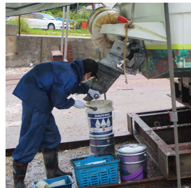
▲船台にて、船のオイル交換作業を体験する様子

体験を終えた生徒から「事業所の方がお客様の予約管理を徹底していて、お客様第一で考えていることが分かった。」「体験中、緊張して声が出せなかった。今後は、どんな時でも声を出せるように努力したい。」「これまで、言われたことを後回しにすることがあったが、体験を終えて、すぐに行動に移すようになった。」「などの声があり、生徒にとって大変有益な学習の機会になりました。受け入れの事業所、関係者の皆さま、ご協力いただき、誠にありがとうございました。