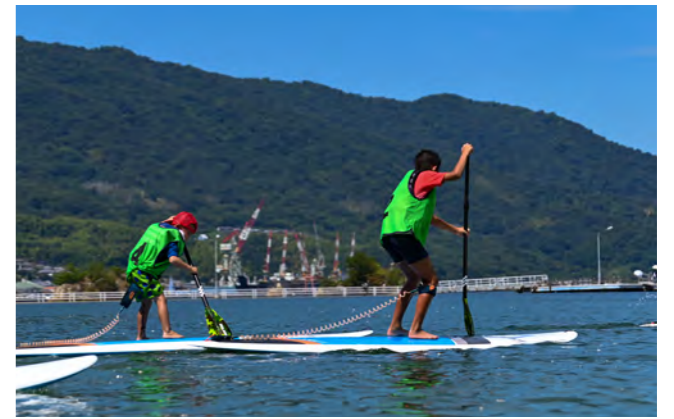
▲白熱したレース（小学生の部の様子）

4人1チームで、カヤック、SUPを漕いでリレーをする江田島湾パドルリレーが長瀬海岸（能美町中町）で開催されました。一般の部はひとり2km、小学生の部はひとり300mで、穏やかな江田島湾の海上で、白熱したレースが繰り広げられました。今年度はプレ大会として開催されましたが、小学生から大人まで多くのチームがエントリーし、来年の正式開催では更なるエントリーが見込まれそうです。