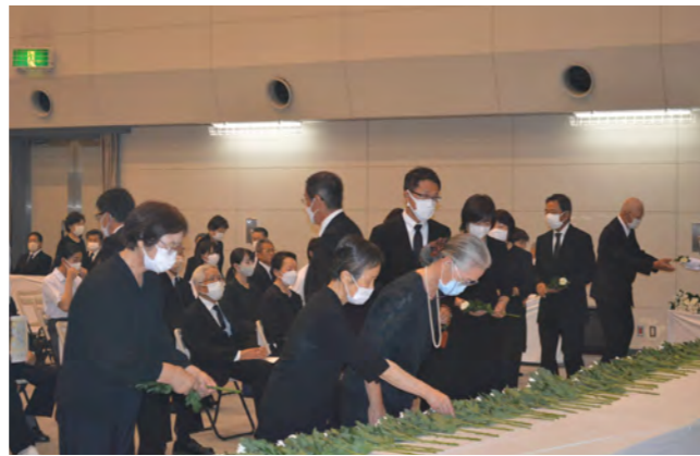
▲江田島市戦没者之霊に献花する参列者

わくわくセンター（能美町鹿川）で江田島市戦没者追悼式を開催し、式典には遺族、来賓、学校関係者、市関係者あわせて約150人が参列。「江田島市戦没者之霊」に献花し、戦没者のご冥福を祈るとともに、恒久平和の実現に向けた誓いを新たにしました。来賓の「追悼のことば」のほか、若い世代に戦争の悲惨さを継承していくため、市内の中学校生徒8名に参列していただき、代表生徒2名が「平和の誓い」を読み上げました。また、カトレアコーラスによる献唱が行われ、「ふるさと」を参列者全員で唄いました。