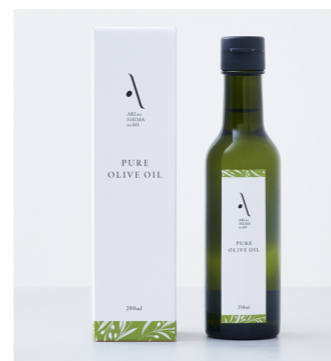
ピュアオリーブオイル 山本倶楽部(株)