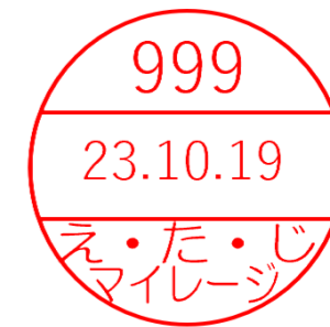
マイレージスタンプ