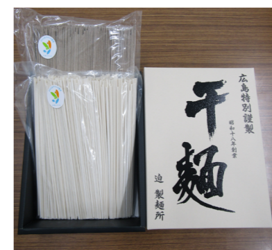
うどん&そばセット 迫製麺所