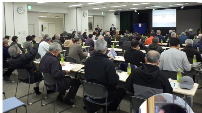
▲防災リーダー研修会の様子